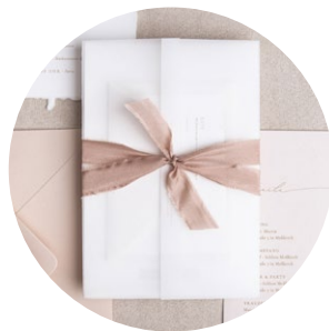
Zweifach geknotet (Blush - Dünn 1,5cm)