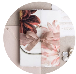
Zweifach gebunden + Schleife (Blush - Mittel 1,5cm)

DIESE LÄNGE MUSS FÜR EINLADUNGEN EINKALKULIERT WERDEN „einfach geknotet“ - 50cm pro Karte kalkuliert „einfach gebunden + Schleife“ - 75cm pro Karte kalkuliert „zweifach gebunden mit oder ohne Schleife“ - 100cm pro Karte kalkuliert