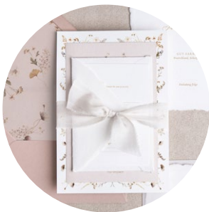
Einfach geknotet (Ivory - Breit 3cm)