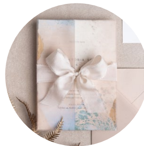
Einfach gebunden + Schleife (Ivory - Breit 3cm)